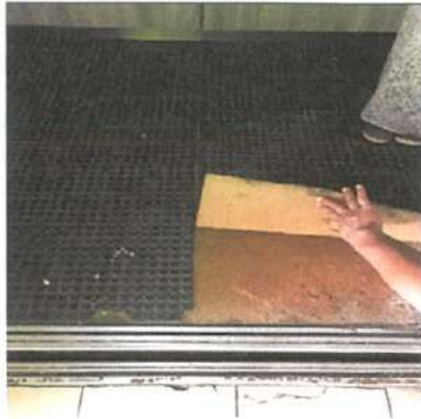
Pintu lif di lobi