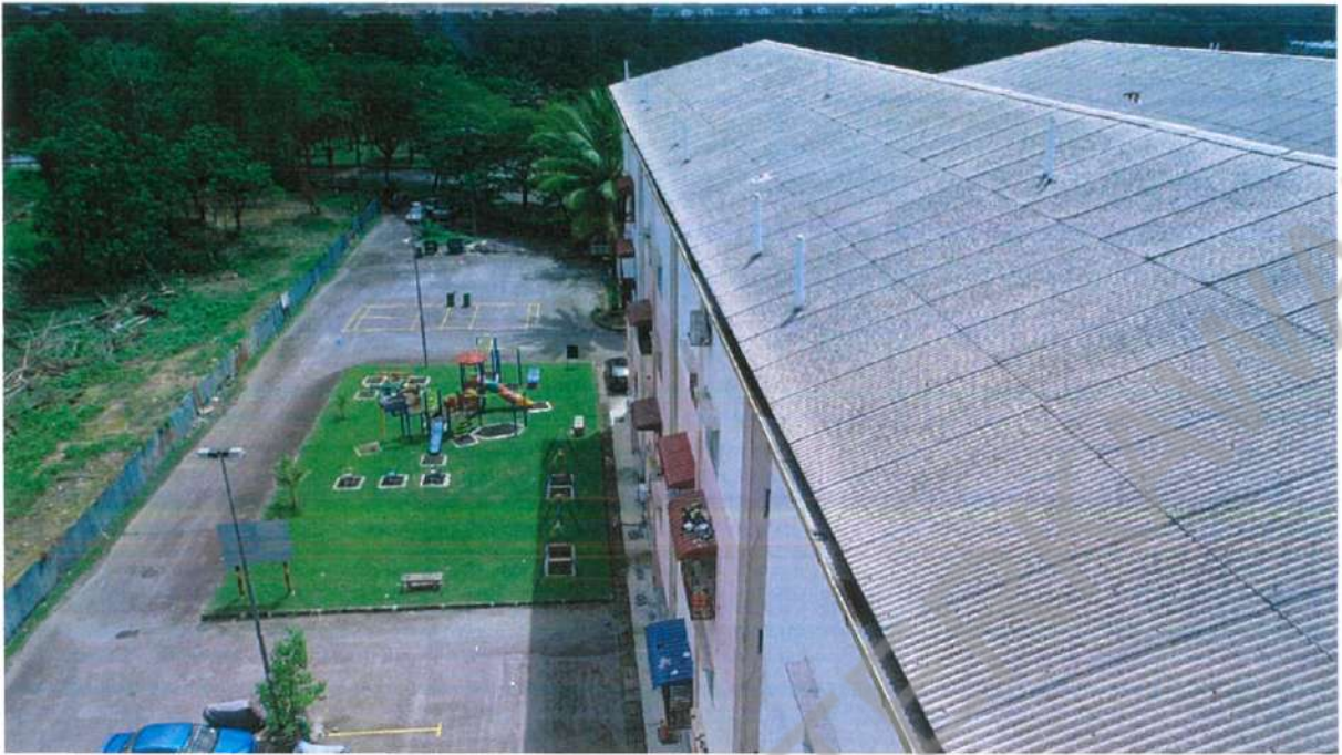
RUMAH PANGSA KOS RENDAH DESA MEWAH, SEMENYIH