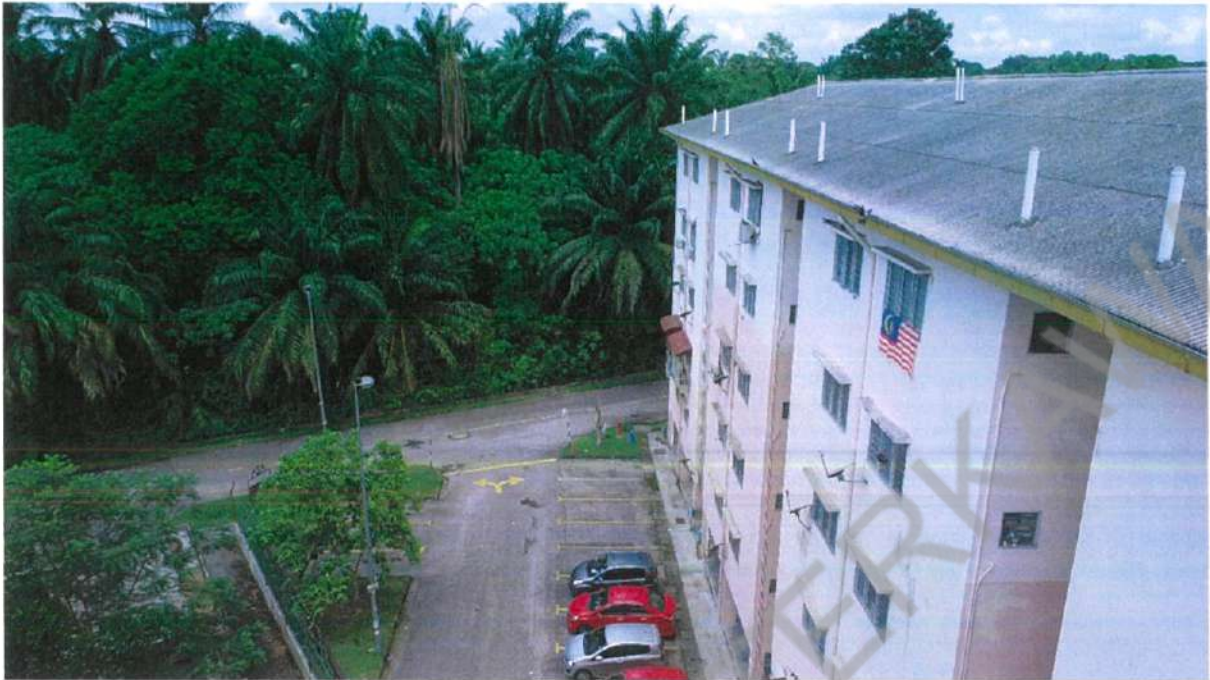
RUMAH PANGSA KOS RENDAH DESA MEWAH, SEMENYIH