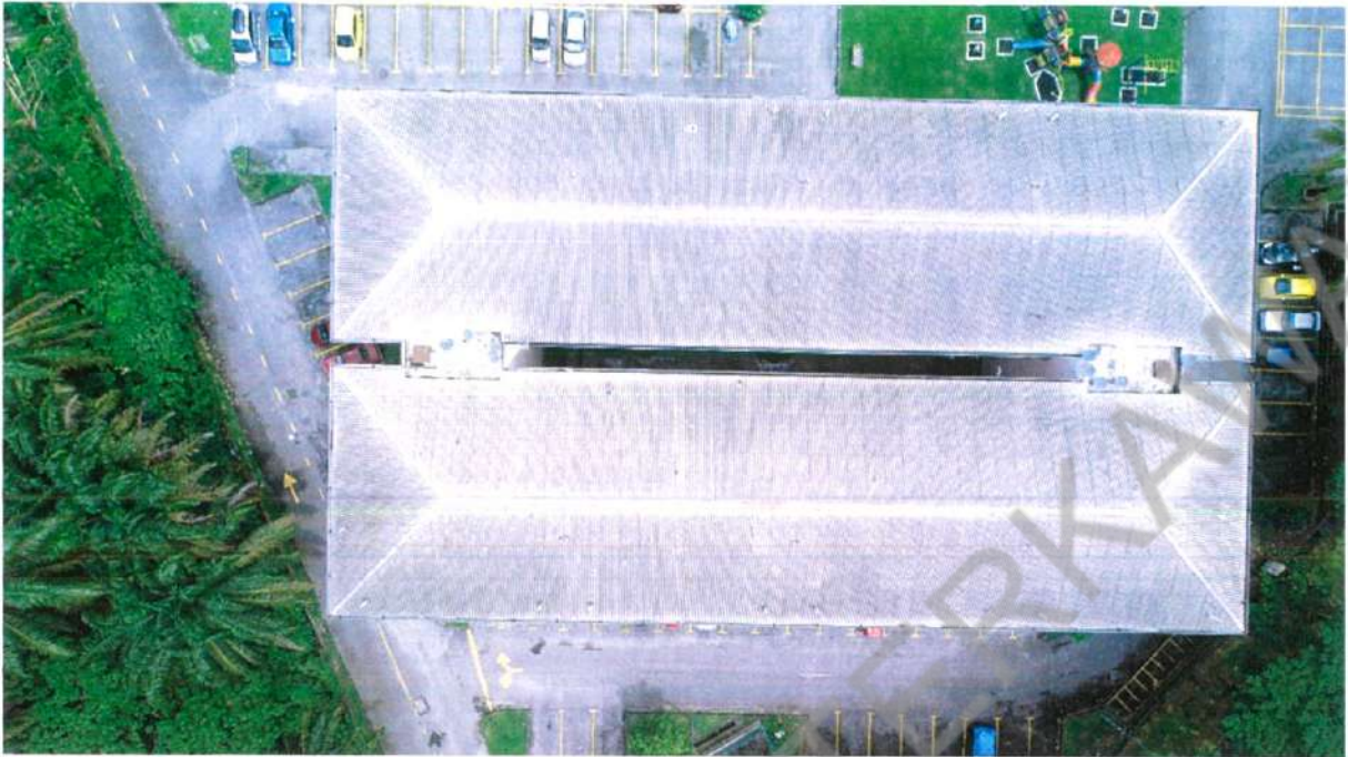
RUMAH PANGSA KOS RENDAH DESA MEWAH, SEMENYIH